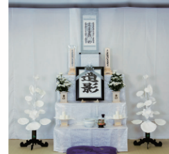
後飾り/中陰飾り棚・ 写真立て・生花・白蓮