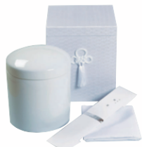
拾骨用品/白壺・桐箱・骨覆い・ 風呂敷・箸