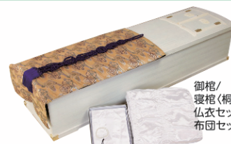
御棺/ 寝棺(桐丸合板) 仏衣セット 布団セット