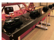
焼香所/焼香台・香炉一式