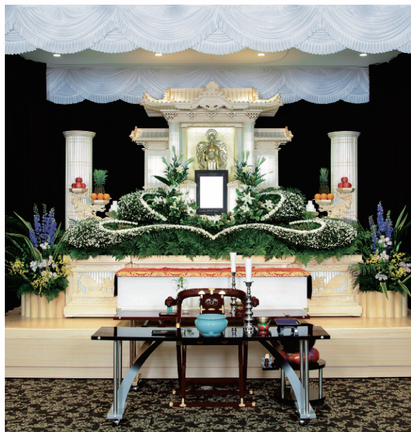
ご葬儀プラン ライン生花付祭壇コース 2口分(36万円)でご利用いただけます