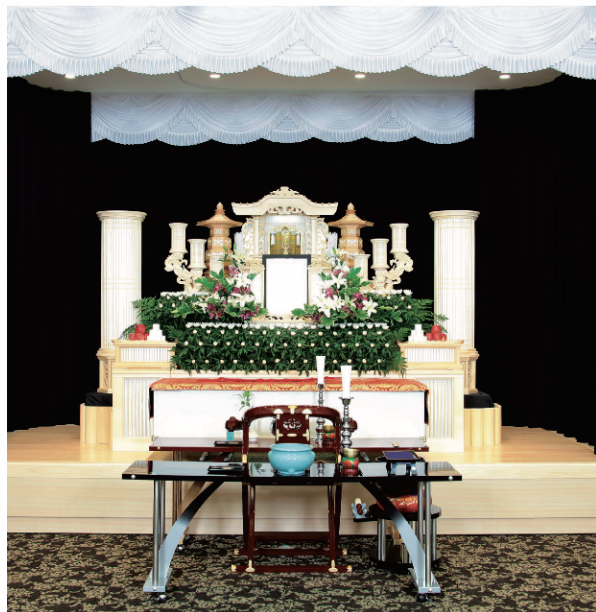
ご葬儀プラン 生花付祭壇コース 1口分(18万円)でご利用いただけます