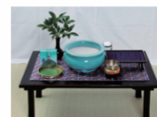
枕飾り/枕経用経机・三具足